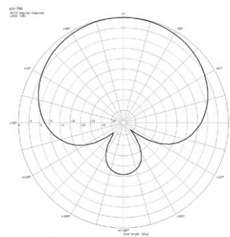
Polardiagramm @ 1 kHz