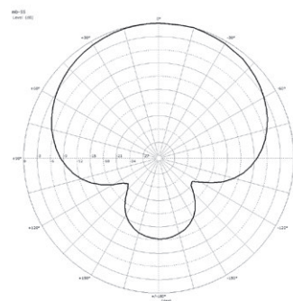
Polardiagramm @ 1 kHz